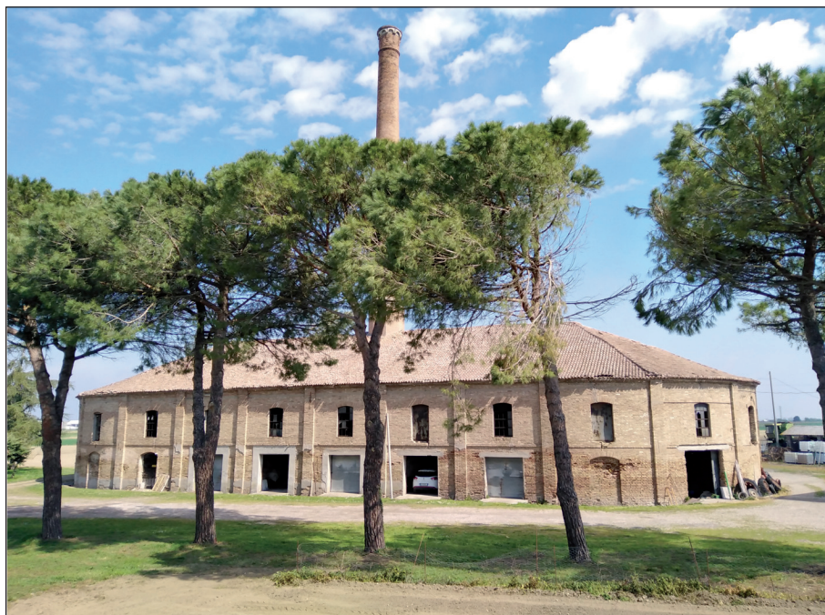
Fotografia Mauro Spotorno, 2023

conservano la cittadinanza elvetica (talora, specie per le donne, si tratta di una doppia cittadinanza), l'attiva partecipazione ai numerosi "circoli svizzeri" presenti nelle aree d'immigrazione 33 , con frequenti momenti di incontro e condivisione tra i discendenti di quei migranti o con chi è rimasto nella madrepatria, volti a rafforzare un comune e condiviso senso di appartenenza ad un'unica identità nazionale. Dall'altra è frequente che anche a distanza di decenni ed in alcuni casi di oltre un secolo, i discendenti di quei fornai vengano ancora qualificati nelle aree del loro insediamento,