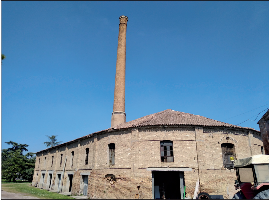
Fig. 2 - Fornace di tipo Hoffman da tempo non più in funzione ed oggi destinata a ricovero per attrezzature di una azienda agricola a Cavarella Po (Rovigo)