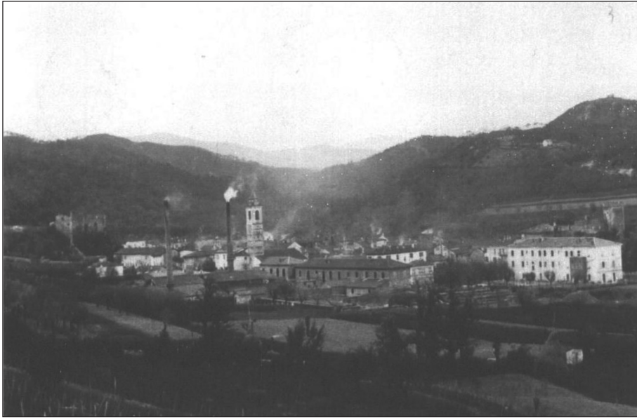
Fig. 5 - Millesimo a fine '800, con in primo piano, sulla sinistra, le due fornaci di proprietà di Filomena Ferrari facilmente individuabili dalle due alte ciminiere